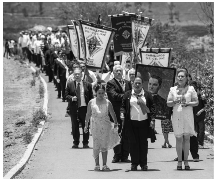
Una procesión nacional hacia el Santuario de los Mártires de Cristo Rey en Guadalajara, México, concluyó con la instalación de un retrato y reliquia del Beato Michael McGivney.