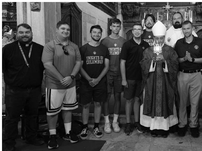
El Obispo Caggiano, junto con Caballeros universitarios, funcionarios y capellanes, sostiene un relicario de McGivney después de la Misa que ofreció en la Iglesia de São Cristóvão en Lisboa el 4 de agosto.

El Día Mundial de la Juventud culminó el 6 de agosto, la fiesta de la Transfiguración, con una Misa al aire libre celebrada por el Papa Francisco, quien dijo en su homilía: "Para todos ustedes, queridos jóvenes, que son el presente y el futuro, sí, para todos ustedes, Jesús ahora dice: 'No teman, ¡no tengan miedo!'"