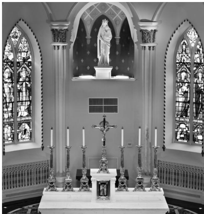
La capilla de Paca Street acogerá a hombres en discernimiento vocacional.