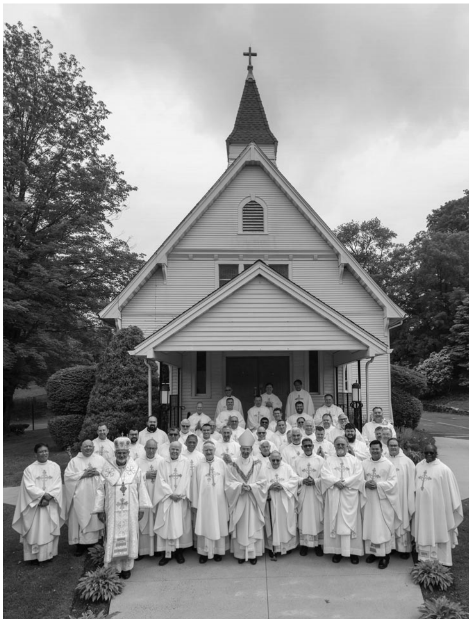
Des aumôniers d'État du monde entier se sont joints à l'archevêque Lori pour un pèlerinage en autobus vers les sites importants dans la vie et le ministère de l'abbé McGivney, y compris la messe à l'église Immaculate Conception à Terryville, au Connecticut (ci-dessus).

En parlant de la vision et de la mission durables de l'abbé McGivney pour l'Ordre, l'archevêque Lori a dit : « Si nous regardons attentivement la vie et le ministère du bienheureux Michael McGivney, nous verrons que sa première préoccupation était le bien-être spirituel des hommes de sa paroisse. Il pouvait voir que certains d'entre eux étaient sur la voie de devenir des catholiques nominaux – exerçant leur foi de façon sporadique ou même pas du tout. Il pouvait voir les défis du mariage et de la vie